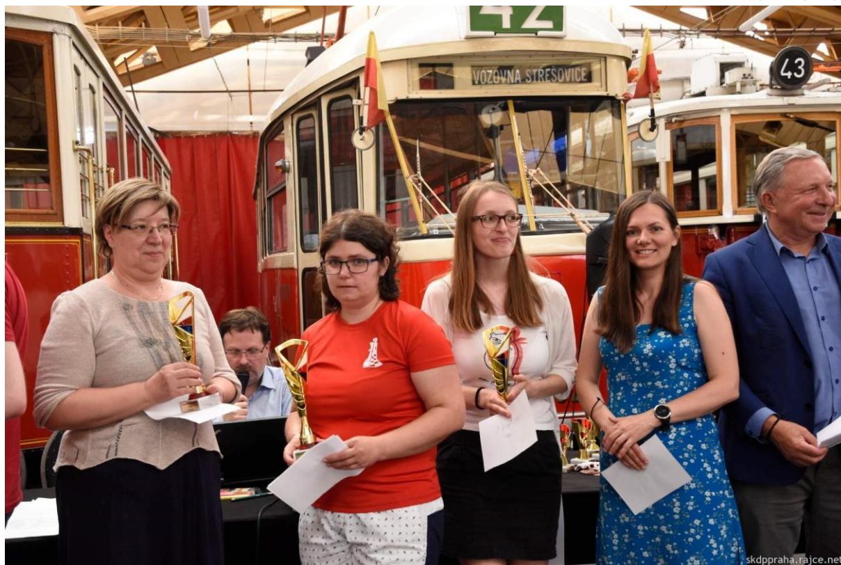
5. Memoriál Věry Menčíkové 2022 – vítězové v kategorii ženy