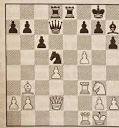
4 postavení po 21...Jxd5