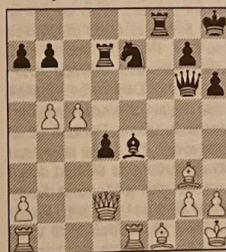
3 postavení po 32...Je7