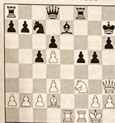
2 postavení po 18...Jc7